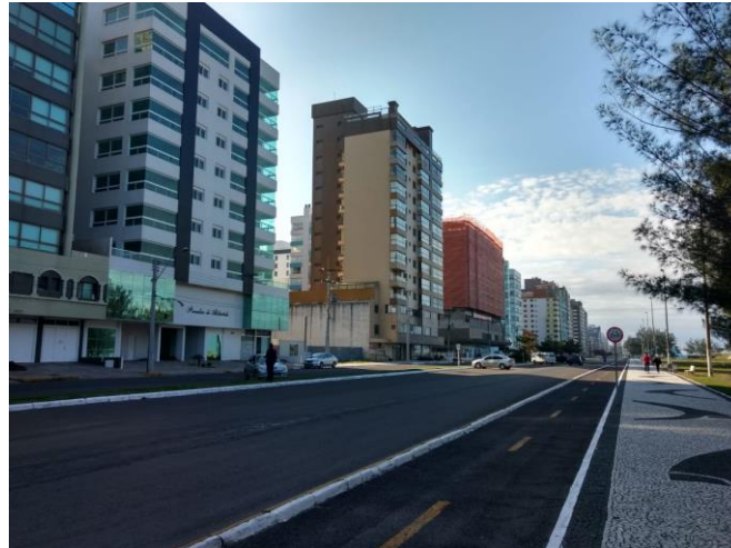
Figura 1 – Avenida Beira-Mar de Capão da Canoa