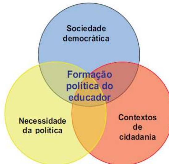
Figura 1: Esferas da formação docente

Fonte: Balbachevsky; Holzacker (2011, p. 501).