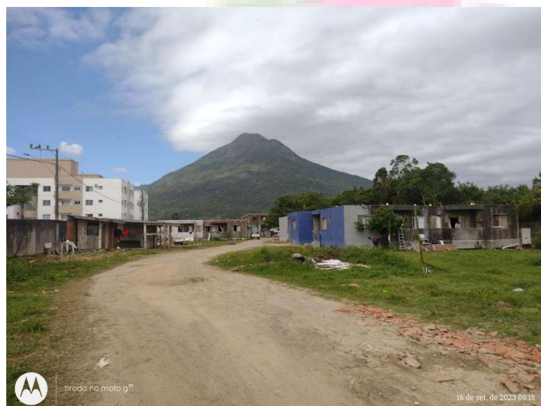
Figura 8 – Aririu da Formiga

Contextualizando novas lutas, a ocupação segue desde o momento neste novo local, onde são realizados eventos de parceria com apoiadores, militantes partidários, acadêmicos, comunidades e outras ocupações da região, com os moradores, criando uma rede de solidariedade. Os eventos promovem o acesso da comunidade à ocupação: são organizadas feijoadas, eventos culturais, dia das crianças, um momento de lazer e de apoio financeiro para as despesas dos moradores. São feitas campanhas de arrecadações de doações de produtos de higiene e cestas básicas, assim como arrecadações de doações de materiais escolares para a construção da Escola Popular da Ocupação, onde gira em torno deste apoio integral aos moradores fornecidos pelos militantes e apoiadores organizados nas dissidências do partido e fora do mesmo.