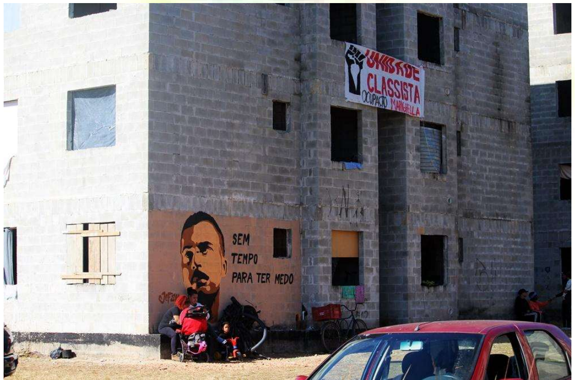
Figura 3 – Ocupação na Guarda do Cubatão

O Projeto Marighella, organizado pelo Movimento pela Universidade Popular (MUP) de Santa Catarina, realizou Caravanas composta por estudantes de graduação de diversos cursos da Universidade Federal de Santa Catarina (UFSC), interessados em conhecer as atividades da Ocupação, assim como em fornecer ajuda na limpeza e na organização do espaço. Este apoio se torna primordial, pois o vínculo destes trabalhadores com os alunos da comunidade acadêmica viabiliza projetos de pesquisa e extensão, assim como se torna tema de trabalhos e outras atividades.