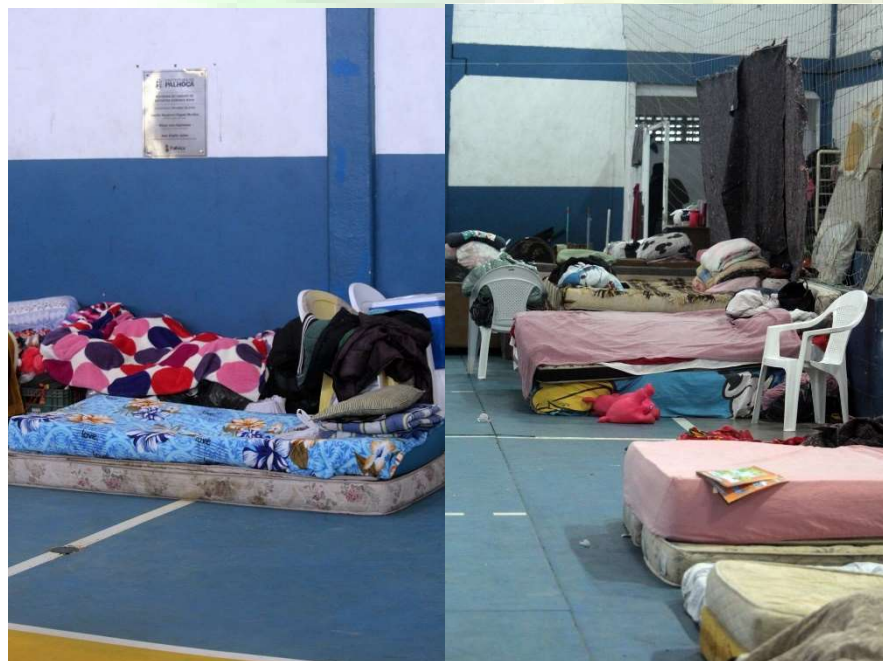
Figura 6 e 7 – Ginásio de Esportes e Organização no ginásio

Para arrecadar doações e atrair apoiadores, a organização da Ocupação Carlos Marighella promove um Festival Cultural e convida diversos artistas da cena do Hip-Hop em Florianópolis, assim como o Slam Cruz e Souza, conhecido por declamar poemas falados, para exaltar a cultura afro-brasileira e os artistas independentes. Na data do evento, no dia 19 de junho de 2022, uma quarta-feira, foi realizada uma assembleia geral com os moradores, onde foram tratadas diversas questões como planejamento mensal das atividades dos moradores, divisão social do trabalho e questões de segurança. A assembleia foi interrompida pelo secretário de assistência social da Prefeitura de Palhoça, que anunciou a proibição do evento. Os organizadores tentaram dialogar com o secretário em vão, e policiais militares acabaram cercando o ginásio. Mídias alternativas de jornalismo entrevistaram moradores, que se sentiram ameaçados e coagidos com a presença da força policial no local.