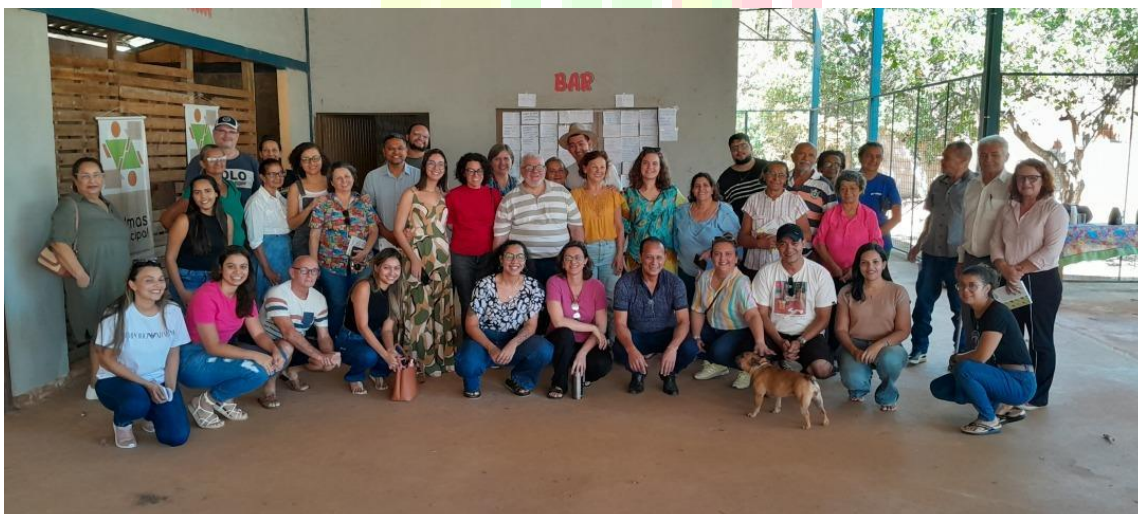
Imagem 3: Reunião da Agenda Popular pelo Direito à Cidade em Taquaruçu Grande.

As lideranças locais pontuaram a falta de apresentação de mapa delineando a área que se tornará urbana e de um estudo de impacto ambiental apropriado para uma determinação tão invasiva.