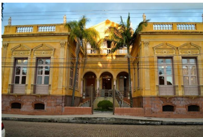
Figura 1. Casarão 6, centro de Pelotas. Tombado pelo IPHAN.

Toda a riqueza e suntuosidade, grandeza e sofisticação (Figuras 1 e 2) estão inextricavelmente ligados ao auge da produção de charque, produto decorrente da salga e cura de carne bovina que depois de sua elaboração final era exportado para outras regiões do Brasil e inclusive para outros países do chamado novo mundo (EUA, Cuba). Foi assim que nasceu a chamada “aristocracia do charque”, uma classe opulenta cuja riqueza foi edificada mediante a exploração da força de trabalho de africanos escravizados. Em 1780 foi erguida a primeira charqueada em Pelotas, sendo que o auge desse ciclo econômico dar-se-á durante a segunda metade do século XIX.