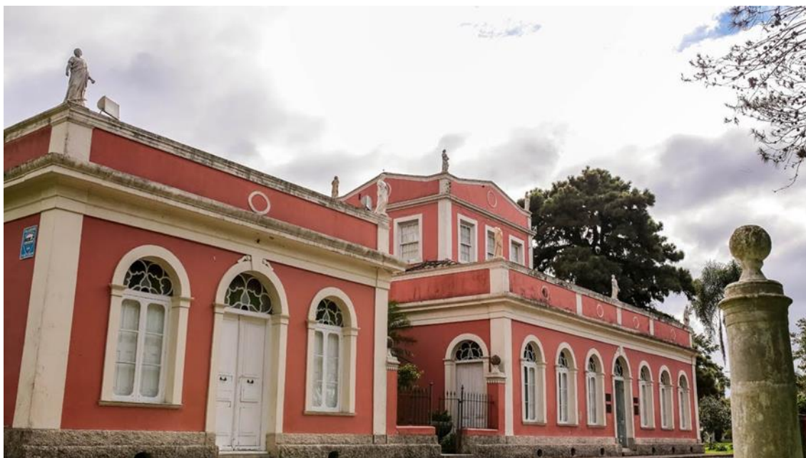
Figura 2. Solar da Baronesa construído em 1863, tombado pelo IPHAN