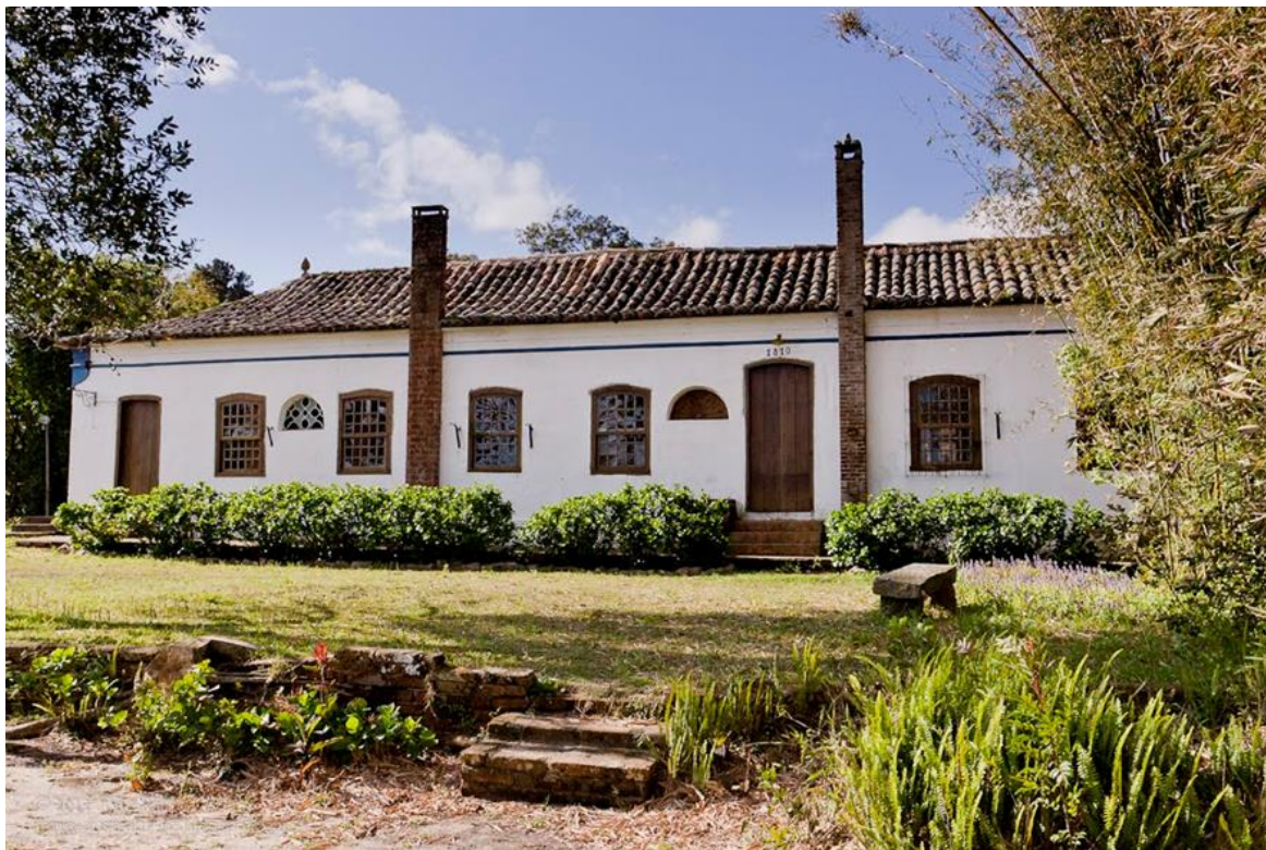
Figura 3. Charqueada São João (Pelotas), onde foram filmadas diversas cenas da minissérie “A casa das 7 mulheres” e há vários anos aberta à visita turística.