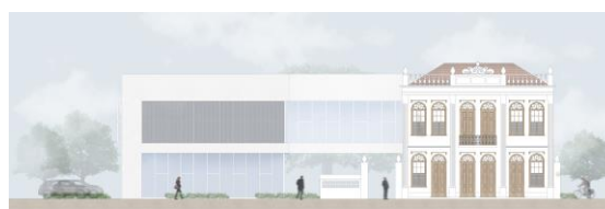
Figura 03. Fachada Oeste, principal na composição projetual.

Outra forma de contraste é atingida pela diferenciação dos materiais aplicados. O vidro e o aço, utilizados como os principais elementos de fechamento do novo edifício, transpassam leveza e contrastam com a edificação histórica, onde o peso é gerado pelos blocos de alvenaria estrutural que a compõem (Figura 03).