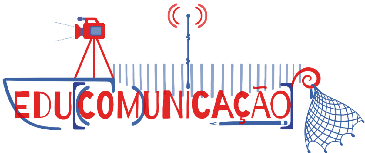
Figura 3 - Imagem-síntese da educomunicação

Nesse ecossistema, a reflexão epistemológica, em determinado espaço-tempo, é orientada para a emancipação dos sujeitos. A ecologia de saberes disponível é operacionalizada pelo princípio ecossistêmico da gestão, que considera a pedagogia da educomunicação no planejamento e articulação das PPE, em espaços escolares ou não escolares. As PPE acontecem a todo o momento ao articularmos, de forma consciente ou inconsciente, nossa capacidade de mediação tecnológica (física), de educação na comunicação (simbólica) e de expressão artística (imaginária). Se nos inserirmos de forma mais consciente nos diferentes círculos de interlocução dos quais participamos, maiores as chances de ajudarmos a manter a nossa saúde psicossocial e a desses ecossistemas educomunicativos. No meu estudo doutoral sobre educomunicação, concebi uma imagem-síntese, materializada pela artista plástica Lu Gâmbaro: 8