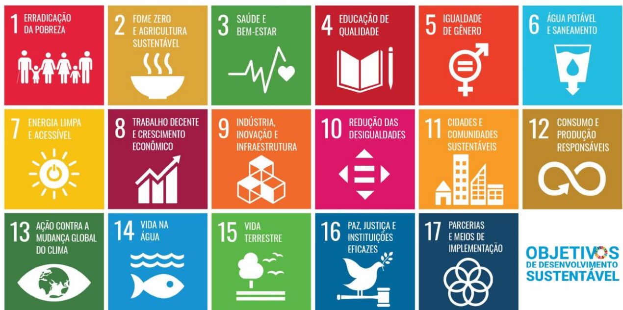
Figura 4 - Objetivos de Desenvolvimento Sustentável (ODS)

Entre os saberes disponíveis sobre sustentabilidade, podemos nos alinhar e/ou alinhar nossas ações socioeducativas aos Objetivos de Desenvolvimento Sustentável (ODS), enquanto parâmetros mundiais.