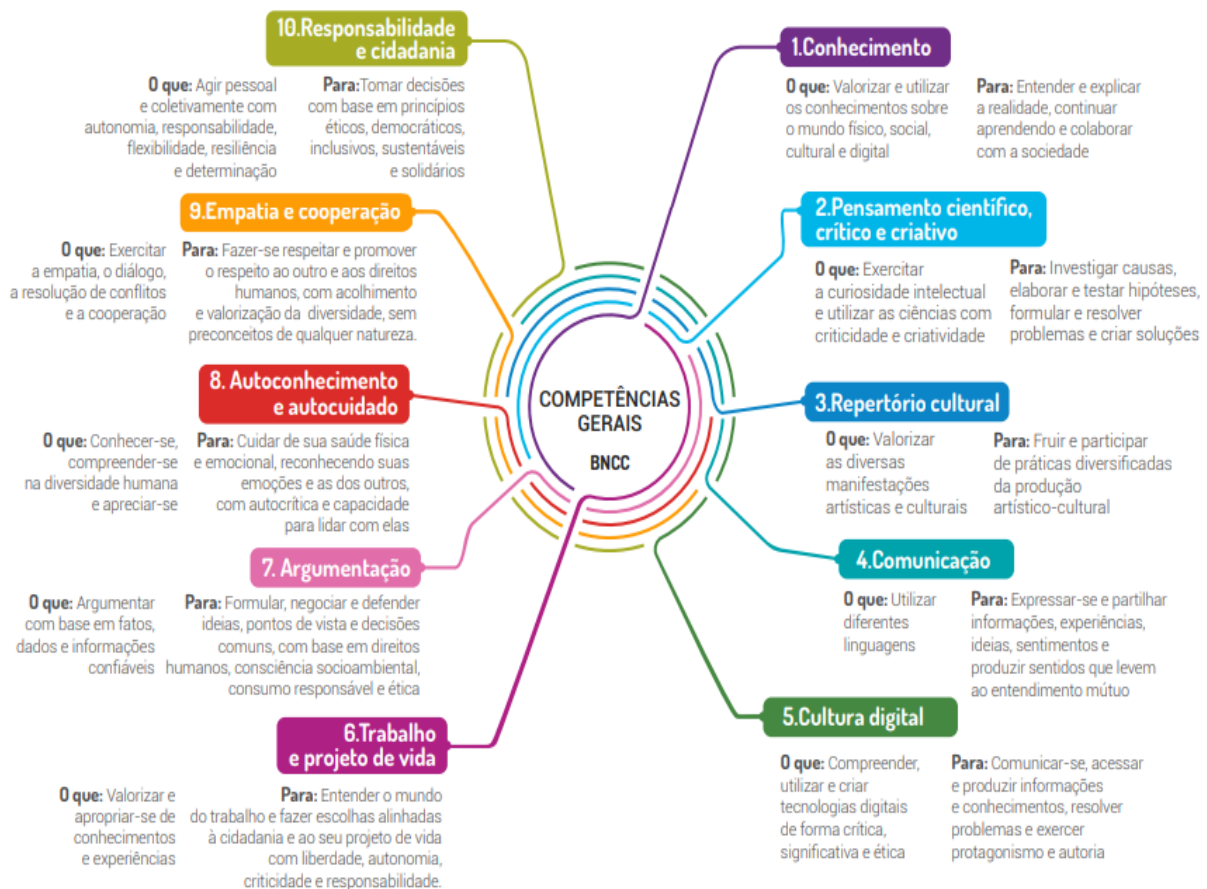
Figura 6 – As competências gerais da BNCC

Na educação escolar, as áreas da educomunicação e os parâmetros mundiais de sustentabilidade encontram eco na Base Nacional Comum Curricular (BNCC) (MEC, 2018). O que podemos observar em suas 10 competências gerais.