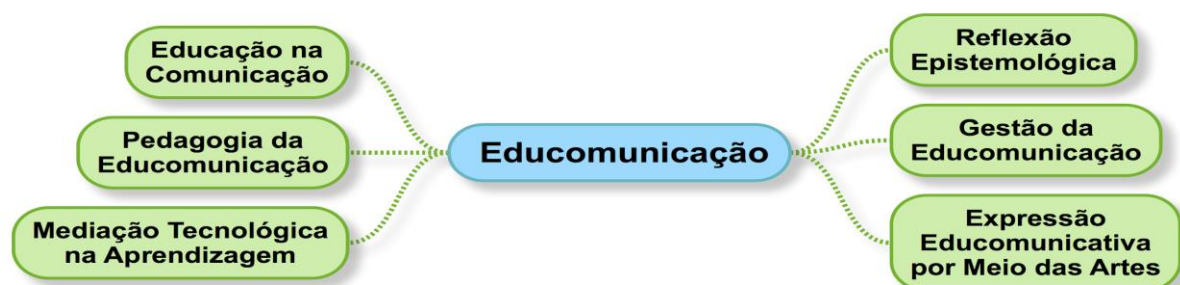
Figura 1 - Áreas da educomunicação

No diálogo qualificamos a informação que, enquanto ato de dar forma à energia, é capaz de transformar a matéria que constitui a sociedade. Com duas décadas de estudos e aperfeiçoamento, a educomunicação tem promovido a atitude crítica, capaz de qualificar o acesso à boa informação. Ela se consolida como um novo campo com seis áreas de intervenção (MARTINI, 2019):