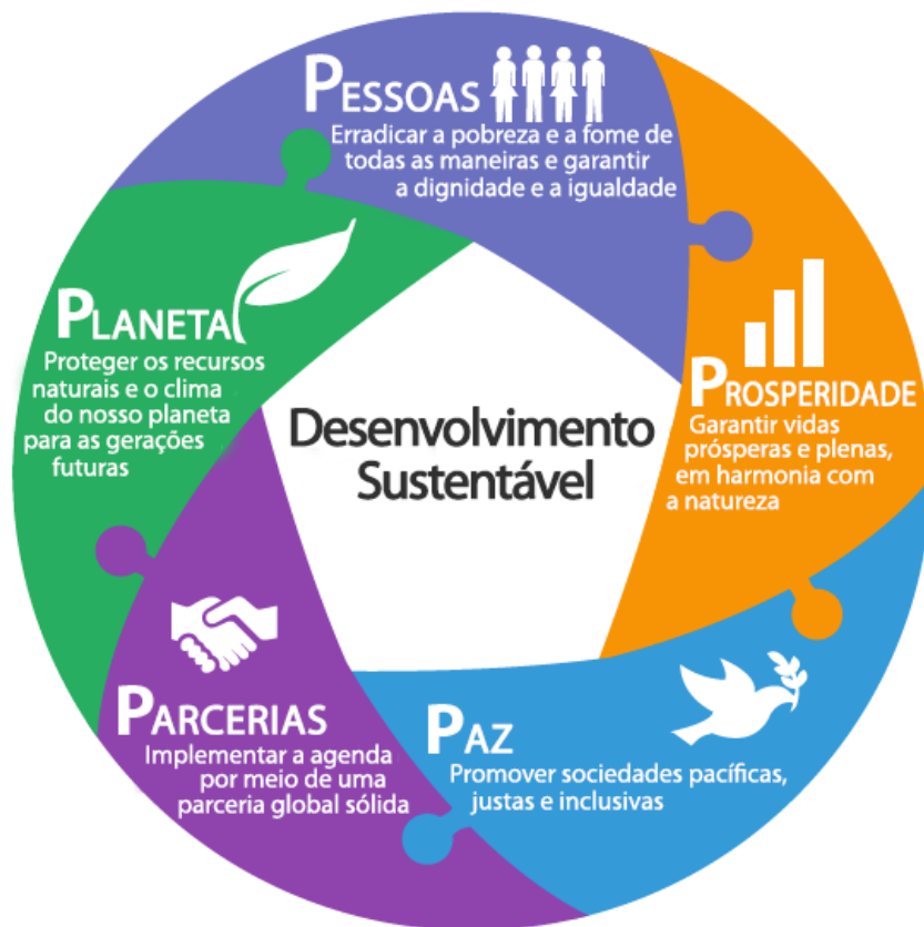
Figura 5 - Cinco pilares dos ODS

de qualidade de vida (SILVA; PELIANO; CHAVES, 2018). Os 17 ODS se agrupam em cinco pilares que facilitam o entendimento e aplicação de seus princípios.