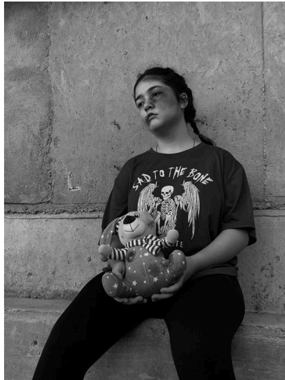
Figura 1: Vulnerabilidade Social.