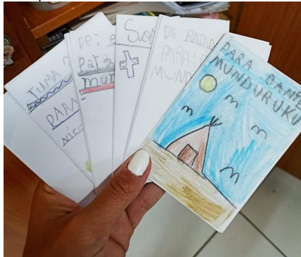
Figura 1: Fanzines a partir da história “Nunca gostei de ser índio” de Daniel Munduruku na semana de atividades voltadas para o dia nacional do livro – 2º ano.

Apresentamos o conto “Nunca gostei de ser índio” de Daniel Munduruku (2016) e propusemos aos estudantes dos anos iniciais que produzissem fanzines a partir da leitura e discussão do texto (figura 1), o qual foi também apresentado por meio da contação de história que o escritor disponibilizou em seu canal no Youtube . No conto, o autor relata ter se descoberto “índio” após sua inserção no ambiente escolar, pois fora assim definido pelos seus colegas e, até então, não conhecia o termo nem o significado simbólico e as conseqüentes violências que o termo carregava.