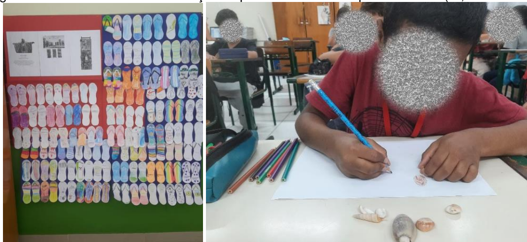
Figuras 4 e 5: Atividades sobre coleções a partir da obra de Bispo do Rosário (1º, 2º e 3º anos).