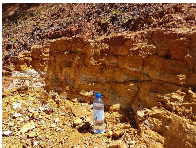
Figura 1. Vista do solo in natura coletado para as amostras

O material empregado na pesquisa, se trata de solo residual da Formação Palermo, localizado na região sul do município de Criciúma/SC. O material é constituído por um solo argiloso, de coloração amarelada. O ponto de coleta, localizado no pátio do IPARQUE – UNESC, possui coordenadas UTM (SIRGAS 2000 22J) E: 685.500 m e N: 6.820.745 m (Figura 1). A coleta do material se deu com o uso de pá. Posteriormente foi seco, destorroado e peneirado.