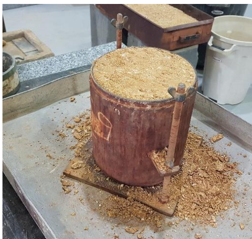
Figura 2. Amostra de corpo de prova moldado em ensaio compactação na energia Proctor Intermediária.

Os corpos de prova foram moldados no Laboratório de Mecânica dos Solos e Pavimentação (LMS) da UNESC. O fluxograma dos processos está apresentado na Figura 3. Os ensaios foram realizados em duplicatas e, contemplaram determinação de índices físicos e de consistência, compactação (Figura 2), CBR, expansão e permeabilidade com carga variável, devido a granulometria predominantemente fina. Quanto aos ensaios de permeabilidade, vale ressaltar que estes foram realizados, também em duplicatas, parte no LMS UNESC e parte no Laboratório de Desenvolvimento e Caracterização de Materiais do FIESC/SENAI. Nos ensaios foram aplicadas normas técnicas conforme Tabela 1.