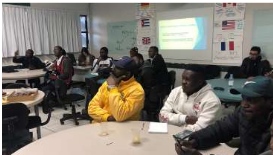
Figura 8: Projeto de Extensão Português Língua de Acolhimento, 2019.