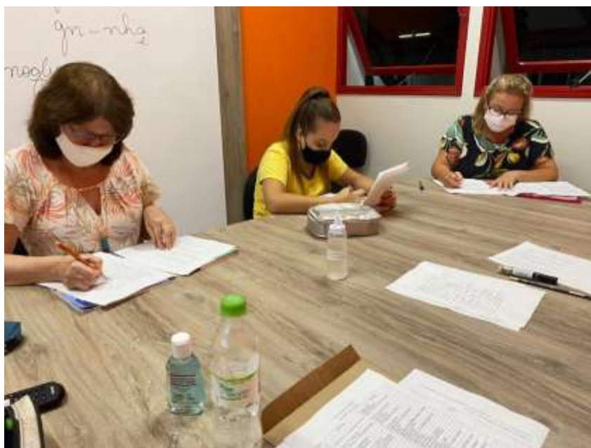
Figura 3 - Aulas com medidas de biossegurança durante período pandêmico