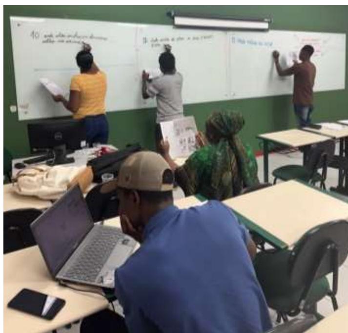
Figuras 9: Aulas de Português Língua Estrangeiras na Escola de Idiomas Unesc

Atualmente, muitos desses alunos cursam sua graduação na Unesc, são líderes e vozes em suas comunidades para aqueles que chegam, atuam na rede pública de ensino como interpretes e professores de Português Língua de Acolhimento (PLAc). Com o encerramento do edital do projeto, a Escola de Idiomas assumiu a continuidade do compromisso com a comunidade e passa a oferecer em seu curso regular de Português Língua Estrangeira , vagas para migrantes em situação de vulnerabilidade.