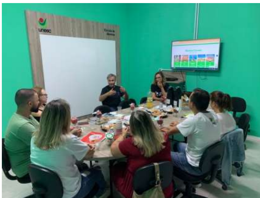
Figura 2 - Novo espaço da Escola de Idiomas Unesc

Figueiredo, o Instituto recebe pela primeira vez um espaço exclusivo para o ensino de línguas estrangeiras, e inicia o funcionamento da intitulada Escola de Idiomas Unesc , uma de suas frentes de serviços. O espaço, alinhando com o que há de mais moderno, recebeu salas climatizadas, com suporte tecnológico de audiovisual, computadores, internet, além de toda a estrutura da Universidade à disposição de professores e alunos (sejam da comunidade interna ou externa à Universidade), como, por exemplo, a biblioteca com mais de 615 mil títulos, os laboratórios de informática, o Laboratório de Pesquisa de Letras (LAPEL), dentre outros. Neste novo local, setorizamos o ensino de línguas adicionais, com cursos nos níveis básico, intermediário e avançado, aulas personalizadas (V.I.P.) e preparatórios para exames de proficiência, em sete idiomas: alemão, espanhol, francês, italiano, inglês, libras e português para estrangeiros.