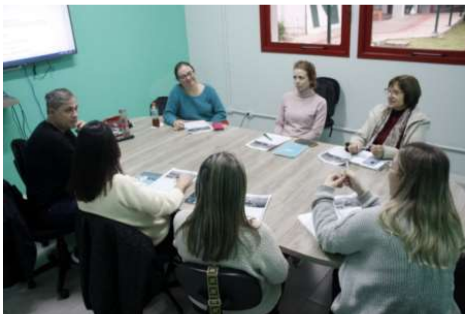
Figura 11 - Turma do Programa Pró-Idiomas

Em 2023, agora em parceria com a Pró-Reitoria de Pesquisa, Pós-Graduação, Inovação e Extensão (Propiex), instalamos o Programa Pró-Idiomas , viabilizando o curso de inglês e espanhol para professores-pesquisadores e técnicos dos programas de pós-graduação da Unesc, de forma gratuita, e com subsidio da Propiex de cinquenta por cento dos cursos de inglês e espanhol para acadêmicos matriculados em cursos Stricto Sensu , tornando a internacionalização uma prática mais inclusiva, construindo ações de internacionalização em casa, no desafio de tornar a internacionalização menos elitista e mais democrática, convertendo o aprendizado de idiomas mais acessível a um maior número de pessoas.