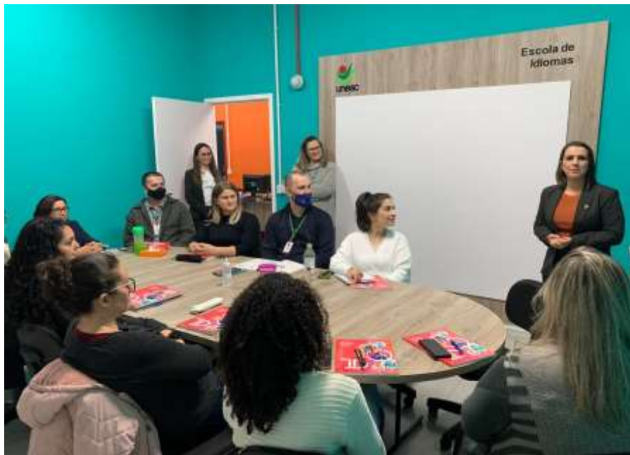
Figuras 6 e 7 - Turma de Inglês para Colaboradores

contextos de práticas linguísticas, dentro e fora da instituição, fazendo parte do processo de internacionalização em casa.