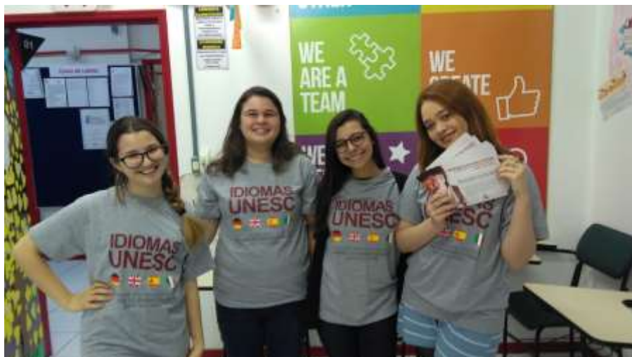
Figura 1 - Divulgação do Instituto de Idiomas Unesc pelo Curso de Letras

quais formamos) pudessem vivenciar experiências de ensino-aprendizagem durante sua formação, ainda na Instituição. Sob a responsabilidade do curso de Letras, muitas atividades começam a ser criadas, com a participação direta de professores e alunos na divulgação do programa, com o intuito de integrar a comunidade e despertar o interesse no aprendizado de idiomas.