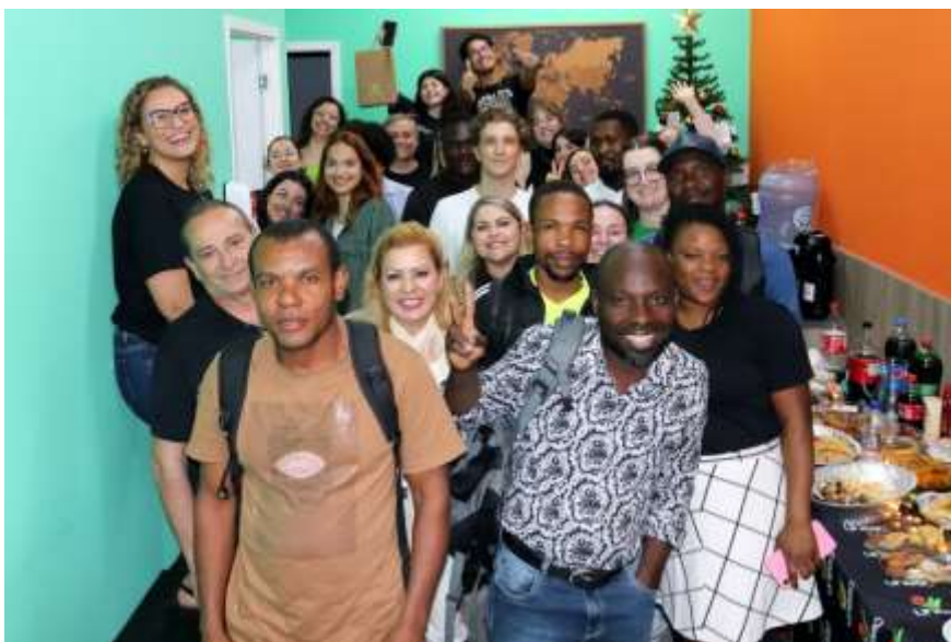
Figura 4 – Celebração de Thanksgiving Day entre aprendizes de Inglês, Italiano, Português para Estrangeiros e acadêmicos de Letras Português

Desde então, a Escola de Idiomas vem trabalhando em prol da educação, principalmente no que diz respeito a ser um facilitador de internacionalizar a educação, não restringindo a questão das línguas a “ofertas de cursos”, de uma perspectiva instrumental, mas sim, ampliando o conceito, falando de “vivências”, “experiências” e “socialização” entre pessoas, culturas e línguas, sempre valorizando a diversidade cultural e linguística.