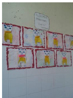
Figura 1 – Atividades das crianças/P2

Ao observar a exposição relacionada a Figura 1, na sala da P2, percebe-se que a produção é resultado de uma atividade em que as crianças receberam o molde do gato e fizeram colagens. Utilizaram materiais diversificados, porém não se diferenciam, são bem parecidos, tem uma moldura com papel picado vermelho, os gatos estão centralizados, com colagem amarela no corpo.