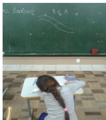
Figura 2 – Modelo de desenho da P1

Ainda com o olhar direcionado para os modelos oferecidos pelas pedagogas, percebeu-se que a P1 nos momentos de observação, oferece modelos, inclusive desenha no quadro e pede que as crianças façam igual. Já a P2 e P3 não disponibilizam desenhos, mas ao perguntar para elas sobre como trabalhavam os desenhos, elas responderam que em alguns momentos elas deixam eles desenharem livremente, da maneira em que eles sabem fazer. Porém, durante o período de observação, não houve atividade relacionada aos desenhos livres.