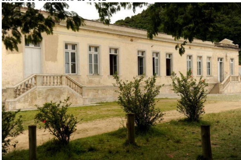
Figura 1: Segundo Grupo Escolar de Santa Catarina – Grupo Escolar Jerônimo Coelho, inaugurado em 12 de dezembro de 1912

Em Santa Catarina, o Grupo Escolar chega primeiramente na cidade de Joinville, através do então Governador Vidal Ramos, do Partido Republicano Catarinense (1910 – 1914), sendo assim, o “ Collégio Municipal de Joinville ”, tornou-se o primeiro Grupo Escolar do Estado de Santa Catarina, cuja denominação foi Grupo Escolar Conselheiro Mafra, inaugurado em 15 de novembro de 1911. Após este evento, no Estado de Santa Catarina acontece a inauguração de mais oito Grupos Escolares: Grupo Escolar Jerônimo Coelho (Laguna), Grupo Escolar Lauro Muller (Florianópolis), Grupo Escolar Victor Meirelles (Itajaí), Grupo Escolar Vidal Ramos (Lages), Grupo Escolar Silveira de Souza (Florianópolis), Grupo Escolar Hercílio Luz (Tubarão), datados de novembro de 1911 a 1920 (SILVA, 2006).