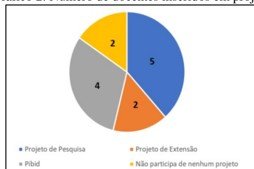
Gráfico 2: Número de docentes inseridos em projetos

Abaixo segue o próximo gráfico sobre a participação dos docentes em projetos: