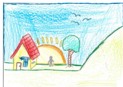
Figura 9 – Nicolas (9 anos e 2 meses)

As Figuras 8 e 9 representam uma evolução propriamente dita do grafismo infantil. Cada desenho apresenta características que mostram essa evolução tanto do grafismo como do desenvolvimento da criança. É possível perceber características que permeiam no Realismo Intelectual se encaminhando para o Realismo Visual a medida que compõem seus desenhos com noções projetivas e euclidianas.