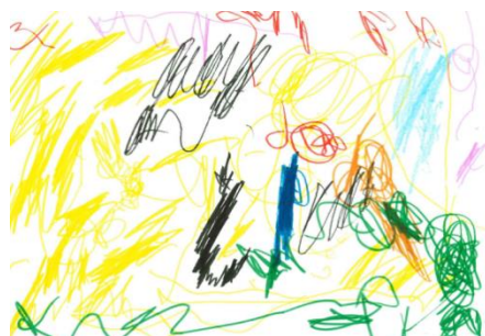
Figura 2 – Helen (3 anos e 3 meses)

Na Figura 1, Joaquim inicia o desenho de maneira tímida, não faz nenhum comentário durante o ato de desenhar, mesmo quando é questionado. Aos poucos, vai percorrendo o espaço da folha, de início com giz de cera alternando com as canetinhas, chegou a ultrapassar o limite da folha para a mesa em determinado momento. Percebe-se que seu traçado é uma forma de resposta neuromuscular pelo simples prazer de rabiscar. Assim, a Figura 1 evidencia, segundo Luquet (1969, p. 136) que “o desenho não é um traçado executado para fazer uma imagem, mas um traçado executado para fazer simples linhas”. Caracterizando a forma de um desenho involuntário.