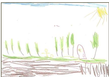
Figura 5 – Alice (5 anos e 4 meses)

o objeto (LUQUET, 1969). E para poder elucidar esta fase é importante ressaltar os processos vivenciados pelas crianças e que estão expressos nas figuras a seguir: