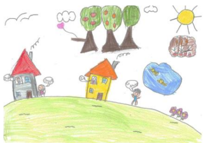
Figura 8 – Helena (7 anos e 2 meses)