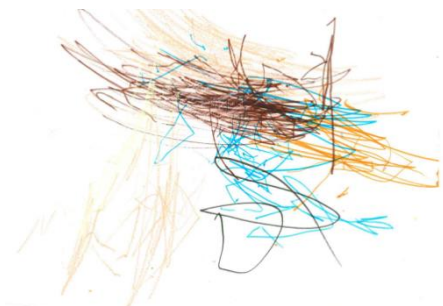
Figura 1 – Joaquim (2 anos)