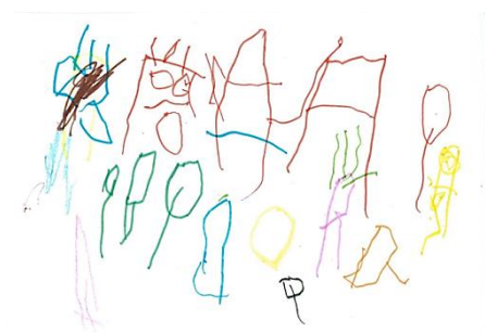
Figura 3 – Antony (4 anos e 3 meses)

A seguir, estão as Figuras 3 e 4 que mostram características do Realismo Falhado.