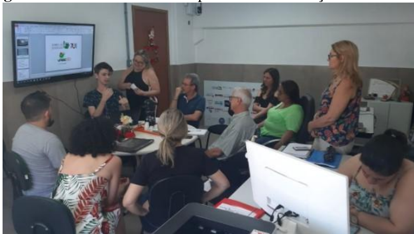
Figura 04: Reuniões multidisciplinar de socialização dos trabalhos