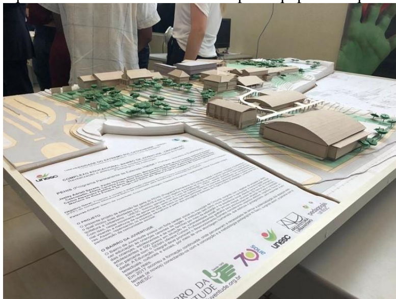
Figura 03: Maquete física esc. 1/250 - elaborada pela equipe de Arquitetura da UNESC