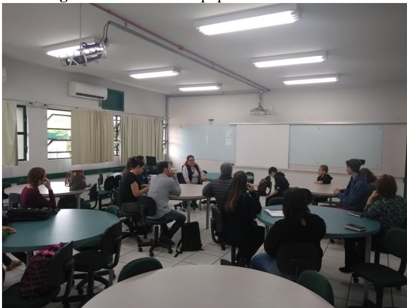
Figura 01 - Reuniões equipes do BJ e da UNESC