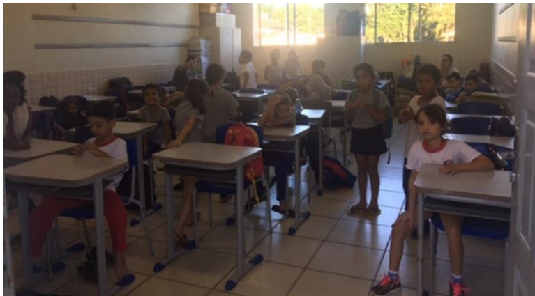
Figura 02: Sala de aula do Ensino Fundamental: carteiras enfileiradas

Conhecer as diretrizes propostas no Projeto Político Pedagógico (PPP) do Bairro da Juventude foi o primeiro passo para que se pudesse entender o funcionamento da estrutura física e pedagógica da instituição, analisando possíveis adequações e principalmente, articular o espaço físico aos princípios filosóficos do documento. Como resultado deste estudo, aliado à observação de como se dava a apropriação dos espaços por parte dos alunos, funcionários e professores, em diferentes horários e atividades, foi possível construir uma maquete (Fig. 03) evidenciando os espaços construídos e as adequações projetadas a partir da análise e desejos dos seus usuários. Assim, a ideia era permitir que os alunos, professores e comunidade escolar percebessem o sentido que o espaço tem para sua formação e a criação de ambientes humanizados e flexíveis a diversas possibilidades de interação de atividades formativas para uma formação crítica, criativa e socialmente integrada.