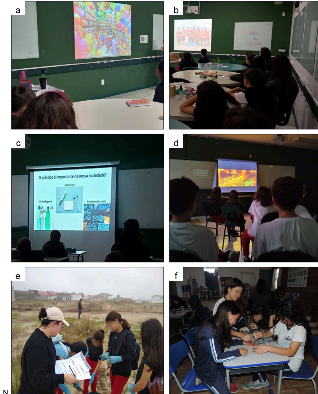
Figura 1: a: Primeira atividade do cronograma, apresentação da palestra sobre introdução ao Lixo Marinho e a importância dos oceanos. b: Palestra e dinâmica prática sobre reciclagem e gestão dos resíduos. c: Palestra sobre a história do plástico e economia circular. d: Sessão de cinema e roda de conversa sobre o filme Wall-e. e: Limpeza de Praia realizada com o colégio UNESC em Balneário Rincão – SC. f: Oficina de montagem de coleção didática.