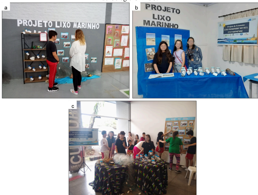
Figura 2: a: Mostra pedagógica apresentada pelos alunos dos 5º anos do colégio UNESC. b: Feira de ciência ocorrida na Escola Manoel Rodrigues da Silva apresentada pelos alunos dos 6º anos. c: IX Feira de Ciência da UNESC, realizada durante a XIV Semana de Ciência e Tecnologia da UNESC apresentada pelos alunos 5º anos do Colégio UNESC.