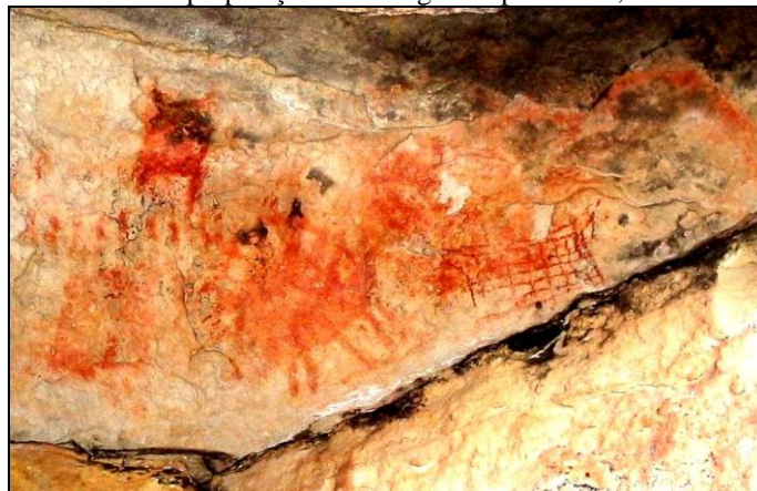
Figura 5. Painel com superposições no abrigo Chapadinha 1, Piraí do Sul, Paraná.

Grande parte das pinturas rupestres no Paraná se caracteriza pela presença de figuras de animais associadas a sinais geométricos, além de seres humanos, em tons vermelhos, marrons e pretos, e raras pinturas em amarelo. Alguns animais foram representados em fila, de perfil, associados a grades, vistos de cima ou de frente, e alguns muito esquematizados. Já foram caracterizadas três fases de pinturas rupestres nos Campos Gerais do Paraná, como no abrigo Chapadinha 1, em Piraí do Sul, sendo a mais antiga, caracterizada por figuras de animais, algumas grandes, com frequência cervídeos chapados, ou seja, pintados integralmente, e associados com grades e outros elementos. A segunda fase, com pinturas geométricas abstratas, geralmente em vermelho, marrom e amarelo, como pontos, círculos e traços, em diferentes tamanhos e espessuras, algumas vezes compõe linhas e desenhos, associadas a figuras humanas e de animais. Uma terceira fase, com silhuetas de animais pintadas em vermelho escuro, e com o interior preenchido por traços que se cruzam, sendo os cervídeos recorrentes (ver figura 5).