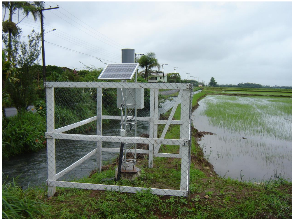
Figura 1. Estação de Monitoramento da vazão de Entrada.

Para o monitoramento da vazão foram instaladas estações telemétricas com sensores de nível no canal de entrada e também nos canais de saída (Figura 2). Em cada estação telemétrica foi colocado um sensor de nível e um pluviógrafo para registrar e transmitir dados em intervalos horários. A vazão no canal de entrada foi monitorada com uma calha Parshall com largura de garganta ( W ) de 1,524 m e nas duas estações de saída foram construídas calhas do tipo CTR, com largura de garganta ( W ) 60,0 cm e comprimento de 180,0 cm, conforme descrito em Back (2015). A estimativa da evapotranspiração foi realizada com base nos dados de evaporação do Tanque Classe A da estação climatológica da Barragem do Rio São Bento, adotando-se o coeficiente K_c igual a 1,2 para todo o período de cultivo. Para o monitoramento da precipitação, além dos pluviógrafos das estações telemétricas, foram utilizados dados de observação de um pluviômetro instalado numa propriedade localizada aproximadamente ao centro da área irrigada e do pluviômetro da estação climatológica da Barragem do Rio São Bento.