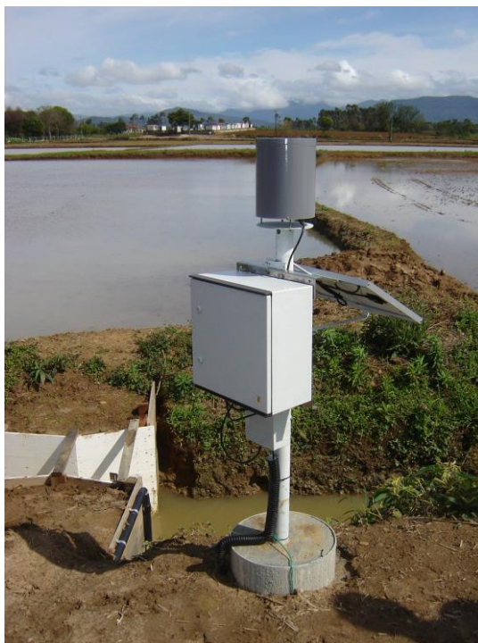
Figura 2. Estação de monitoramento de vazão de saída