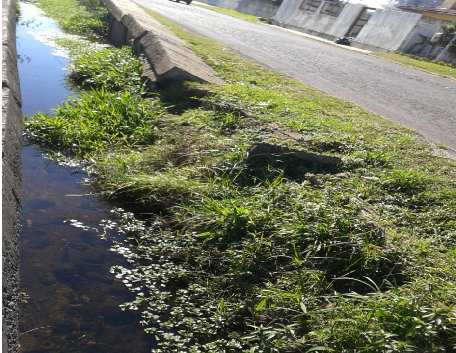
Figura 4 – Destruição do muro de contenção

minimizado com a adequada frequência da coleta, educação da população e multas pesadas” (DEP, 2017, p. 8). Nesse sentido, a educação ambiental passa a ser, também, um grande desafio ao planejamento e à gestão do processo de limpeza urbana.