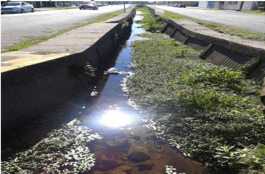
Figura 5 – Calçadas às margens do Arroio