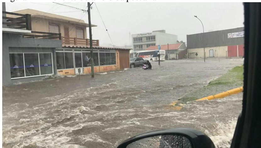
Figura 2 – Enchente do arroio da pescaria

Conforme a Figura 1, no encontro da Avenida Martinho J. Espindola com a Rua General Osório – no Bairro Santa Luzia, observa-se que o arroio não suporta mais certas quantidades de chuva, seja pelo fato do seu lençol freático ser muito alto, seja pela falta de limpeza do Arroio.