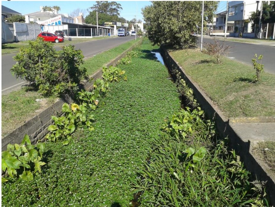
Figura 3 – Arroio da Pescaria

Certo é que não dá para voltar atrás, pois, nessa situação, é válido o dito popular “o que tá feito tá feito”. Porém, é algo para se pensar, quando da realização de semelhantes projetos futuros, pois se deve aprender com o passado para não se cometer os mesmos erros no futuro.