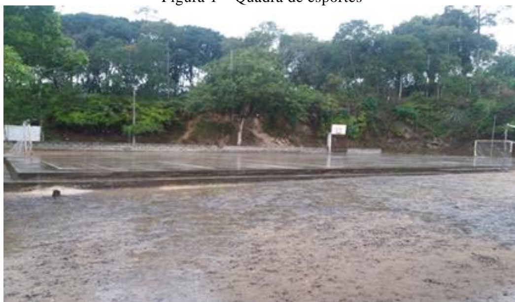
Figura 1 – Quadra de esportes

Todas as fotografias foram tiradas pelos alunos, os locais foram escolhidos por eles e pela direção, no entanto as crianças tiveram total autonomia para realizar o ato de fotografar.