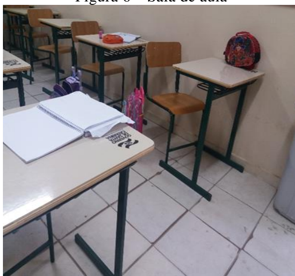
Figura 6 – Sala de aula

Somente uma aluna menina escolheu sua classe como local preferido, pois suas melhores amigas sentam-se ao lado dela e essa se sente protegida, pois passa por um momento de luto pela perda de um familiar.